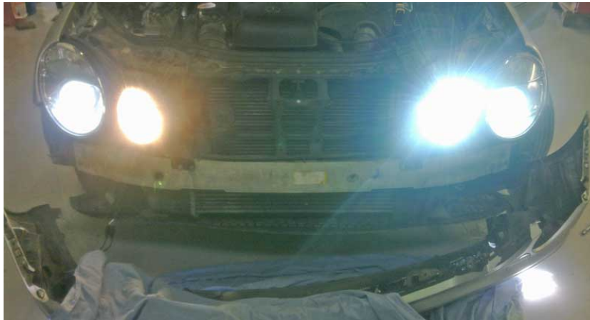
Bildet over viser også den enorme forskjellen på halogen fjernlys og xenon fjernlys

Delene vi brukte er: 12v ballast kabel 35w ProSystem ballast D2 kobling